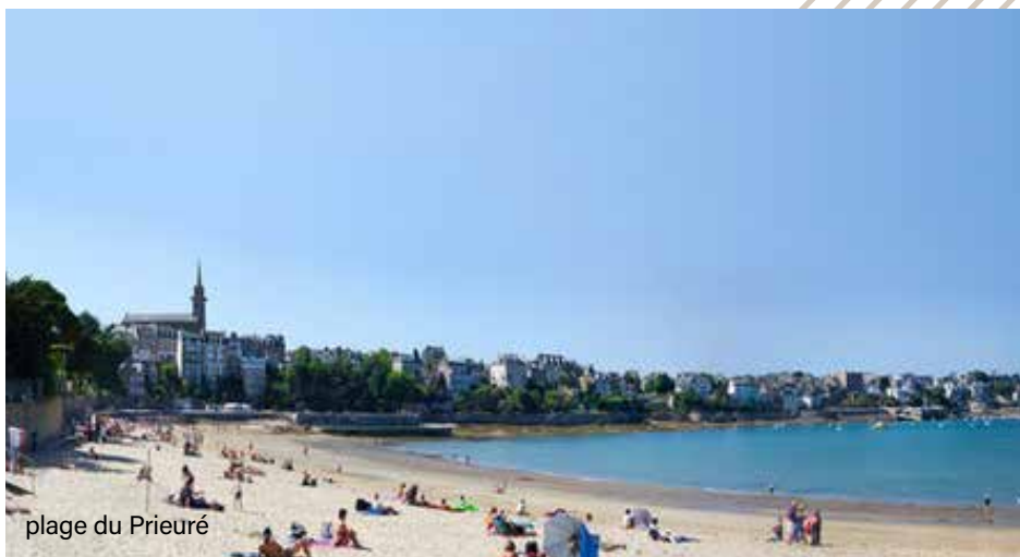
plage du Prieuré

La résidence est à 10 minutes à pied de la plage du Prieuré, une plage familiale qui permet d'accéder directement à pied ou à vélo au port de plaisance de Dinard et à la grande plage. Au sud, on s'échappe facilement par la D168 qui mène d'un côté au barrage de la Rance et de l'autre aux zones commerciales.