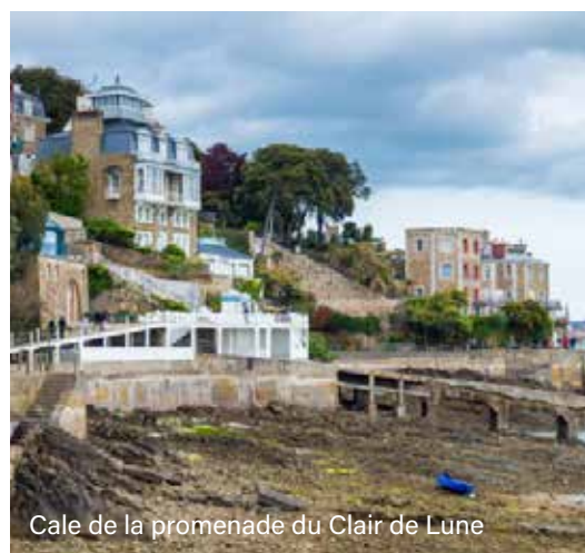
Cale de la promenade du Clair de Lune