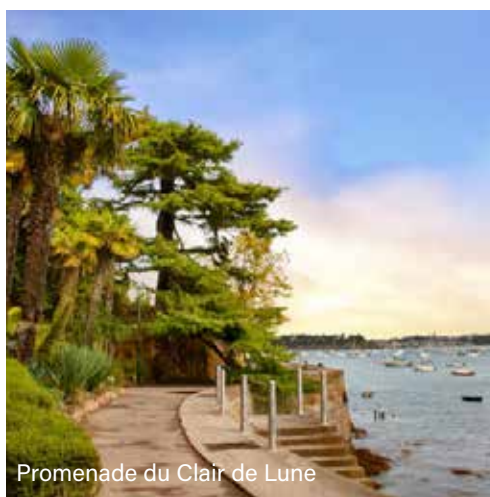
Promenade du Clair de Lune

2 immeubles du T3 au T4 Duplex et 1 maison T5